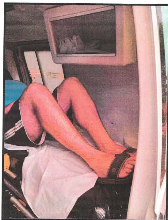
Imagens: Ambulância do Distrito, de pequeno porte.