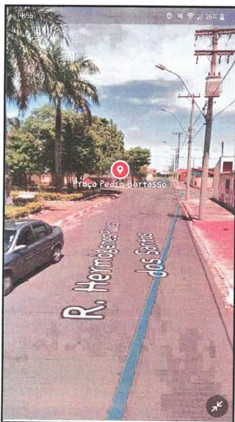
Praça Pedro Bertasso – munícipes relatam que não estão recolhendo o lixo.