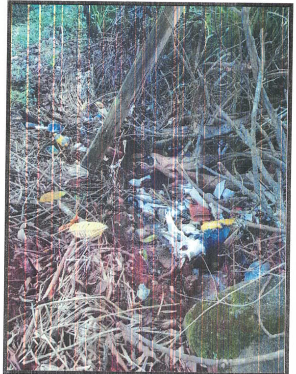
Rua Lucindo Barreto nº 274, Distrito de Igarai