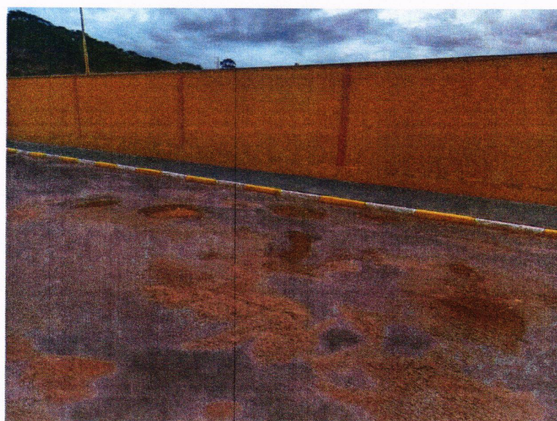
Imagens: Rua Santo André entre os números 51 e 147 -