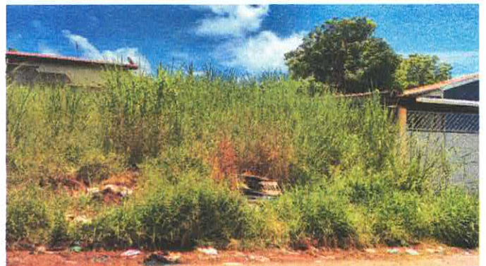
Imagens: Rua Menarda Correa da Silva, Residencial Samambaia.