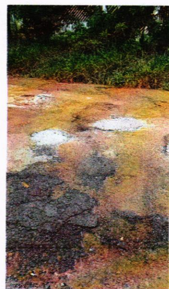
Imagens: Rua Otávio dos Santos, Vila Carvalho. Situação precária de parte do pavimento em contraste com trecho já provido do reparo asfáltico.