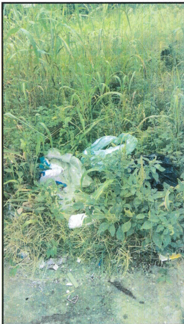
Imagens: Rua Rua Pernambuco ao lado do número 32.