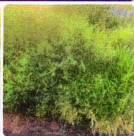
Imagens: Rua Vitor Batista da Silva, Alta Vista