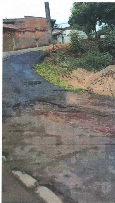
Imagens: cortes asfálticos no Distrito de Igarai