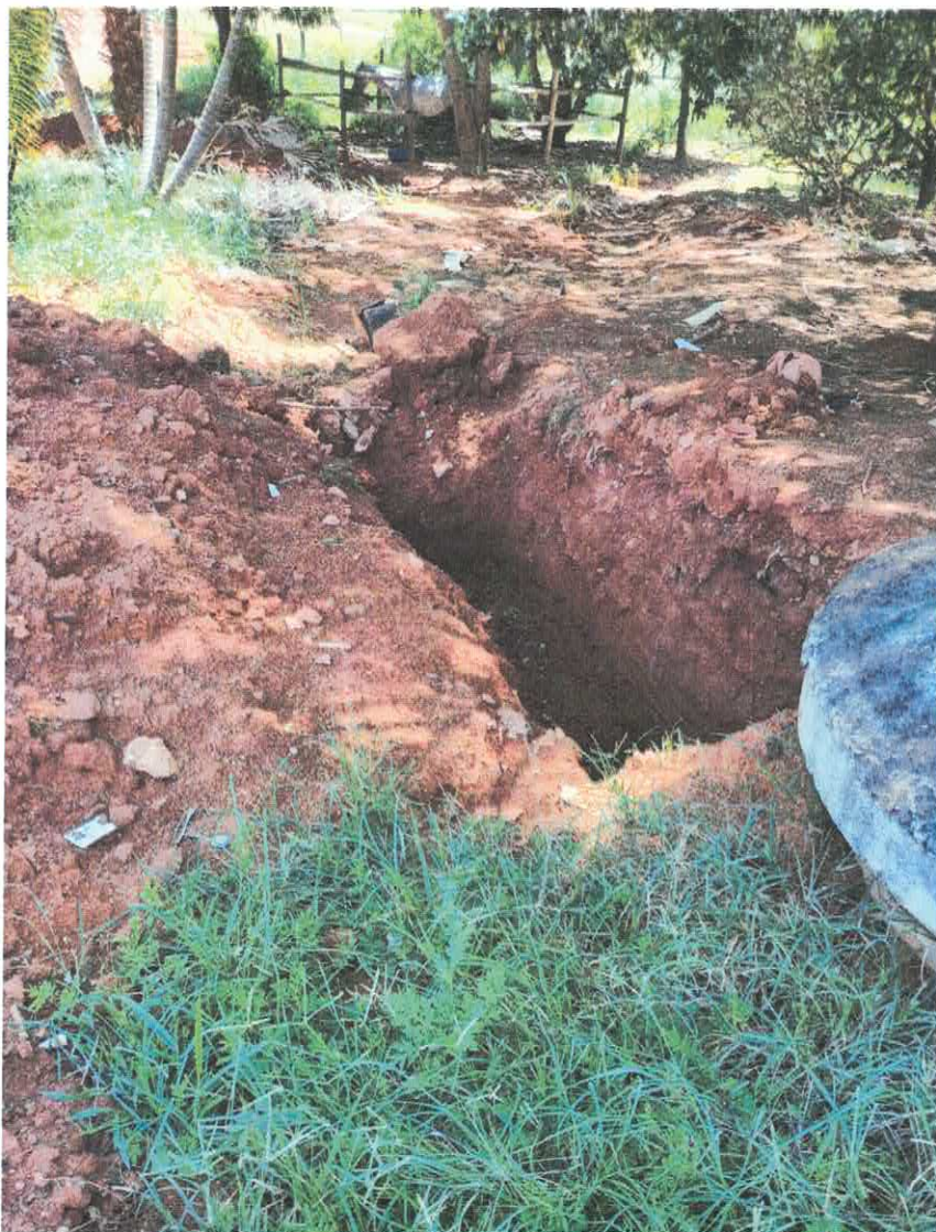
Imagens: Rua José Gomes, no bairro Guilherme Zanetti, Distrito de Igarai