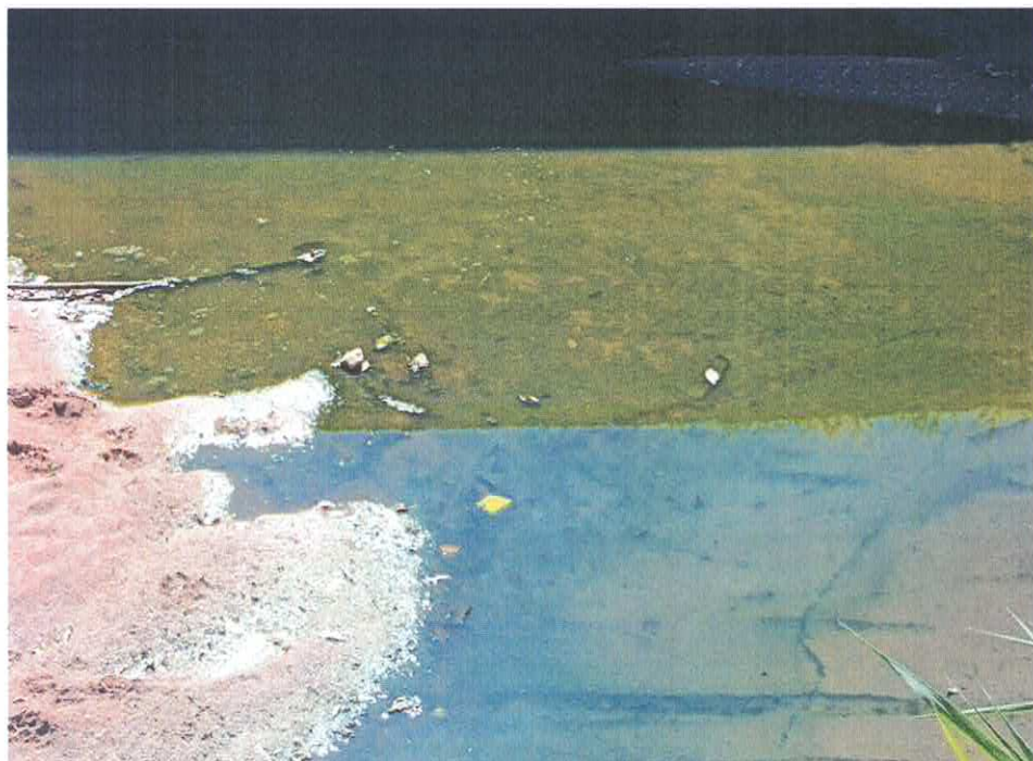
Imagens: entrada do bairro COHAB II – Mococa/SP