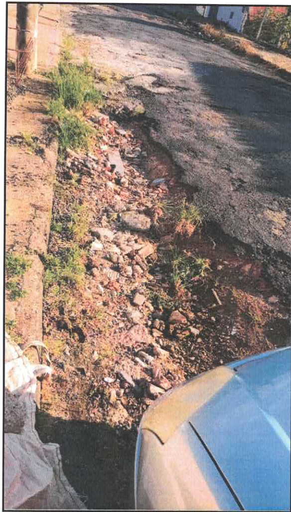
Imagens: Rua Luiz Spinelli, do número 891 ao 960. Rua Natal Cominato, do número 939 ao 975.