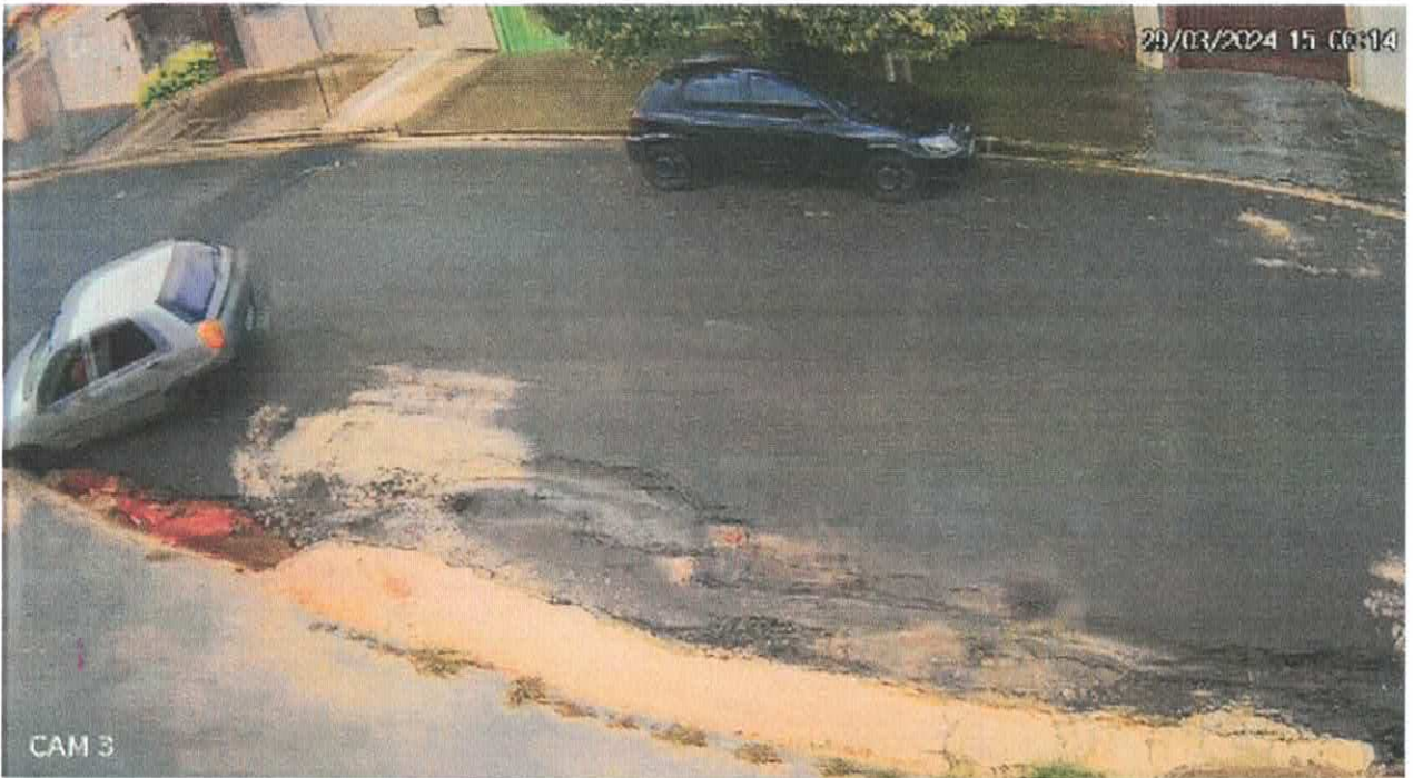
Imagens: Rua Adalton Pereira do Lago, altura do nº 190, Anita Venturi Prícoli