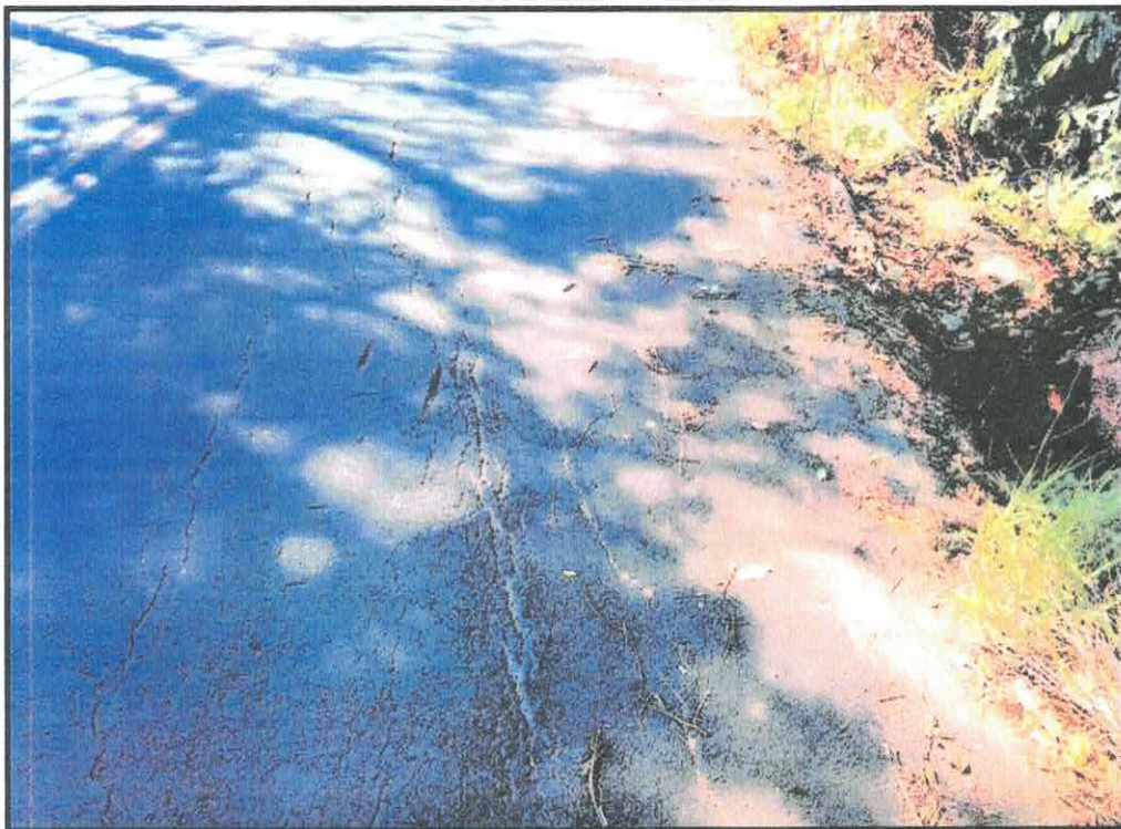
Imagem: estrada vicinal Mococa-Cassia dos Coqueiros, uns 100 metros antes do primeiro redutor de velocidade.