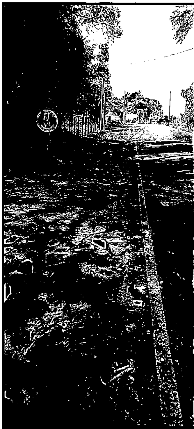
Imagem 3: Condição atual do local, com canaletas aterradas.